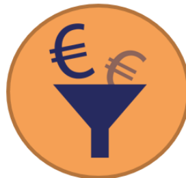
Witwassen/ fin ecriminaliteit